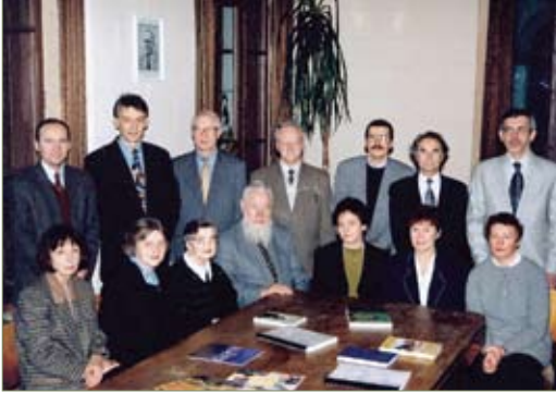
V suvažiavimo metu išrinkta LBD valdyba

I jaunųjų biochemijos ir molekulinės biologijos mokslininkų konferencija, 1996 m. gruodis.