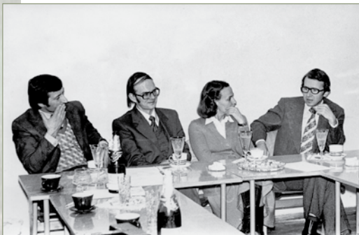
Vilniaus universiteto biochemikai

II suvažiavimas „Biochemijos metodai“, 1975 m. spalis.