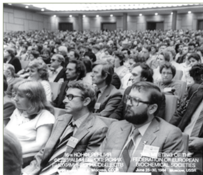
Lietuvos biochemikai FEBS konferencijoje Maskvoje

LBD nariai: 1983 m. – 272; 1990 m. – 260.