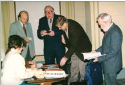
V LBD suvažiavimas

V suvažiavimas , skirtas LBD veiklos 35-osioms metinėms pažymėti (1995 m. spalio).