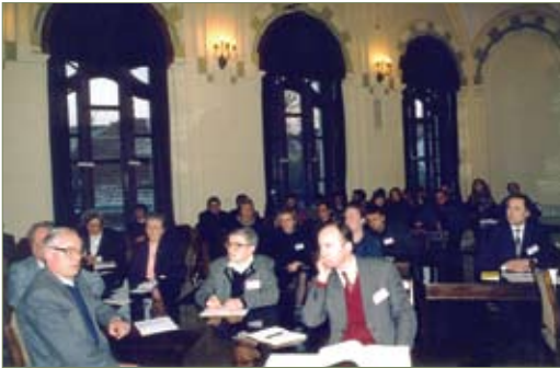
II jaunųjų biochemijos ir molekulinės biologijos mokslininkų konferencija

II jaunųjų biochemijos ir molekulinės biologijos mokslininkų konferencija, 1998 m. gruodis.