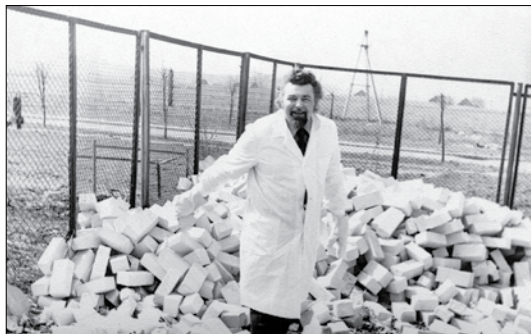
Doc. A. Glemža