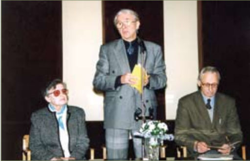
VI LBD suvažiavimas

VI LBD suvažiavimas , skirtas draugijos 40-mečiui, įvyko 2000 m. spalio 26–27 d. Vilniuje.