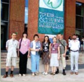
LBD nariai 30-ojoje FEBS konferencijoje Budapešte

LBD gavo naują registracijos kodą ir paramos gavėjo statusą. Tai įgalino įforminti paramos šaltinius. LBD renginių rėmėjai – Lietuvos švietimo ir mokslo ministerija, Valstybinis mokslo ir studijų fondas, taip pat Lietuvos verslo įmonės: „Fermentas“, „Sicor Biotech“, „Expertus Vilnensis“, „Linea Libera“, „Labochema“, „Armgate“, „Grida“, „Biometrija“, „Vildoma“, „Instrumentation Laboratory (Lietuva)“, „Avsista“, „Beckman Coulter“. LBD gavo teisę gauti fizinių asmenų 2 proc. pajamų mokesčių paramą.