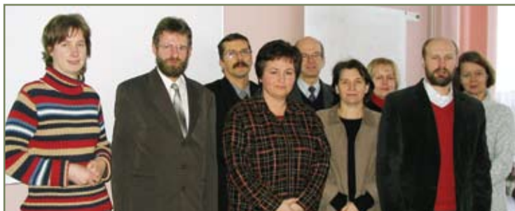
VIII suvažiavime išrinkta LBD valdyba