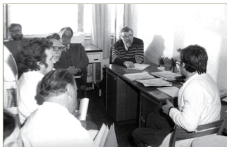
Pasitarimas Enzimologijos institute

LBD nariai: 1972 m. – 104; 1975 m. – 162.